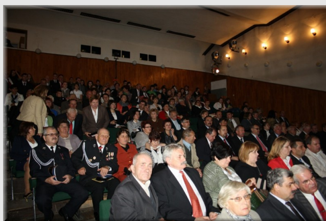
Sala widowiskowa GOK, SiT